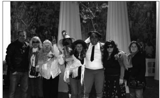
'Tarde de toros en Cehegín' se hizo con el 'Mascarón de Oro 2011'