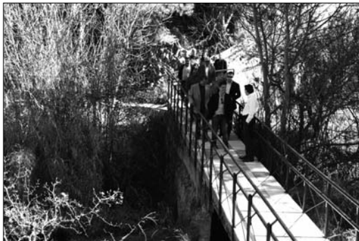
El puente que une la pedanía con la Casa Alta también ha sido arreglado

En este cortijo se han invertido alrededor de 460 mil euros, ya que