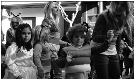
El desfile infantil volvió a sacar a las calles a multitud de personas