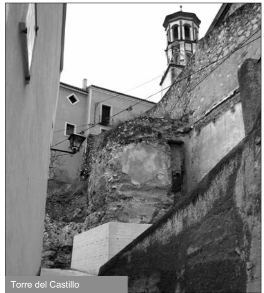
Torre del Castillo

Según el Padrón de vecindario mandado elaborar por los Reyes Católicos, en 1495, había 262 vecinos en Cehegín, entre los cuales había un clérigo, 79 hidalgos y 182