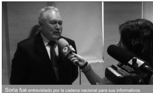
Soria fue entrevistado por la cadena nacional para sus informativos