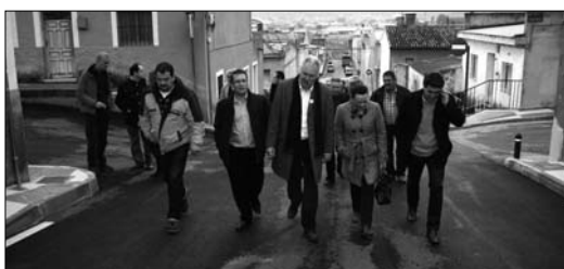
La empresa ceheginera JUYMA VALLADOS ha realizado estos trabajos

La empresa ceheginera JUYMA VALLADOS SL ha sido la encargada de acometer estos tra-