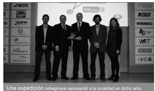
Una expedición chegegínera representó a la localidad en dicho acto