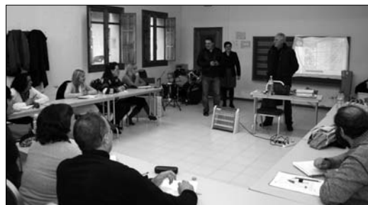
Este curso tiene una duración de 7 meses, y una inversión de 60 mil euros

Los alumnos también están recibiendo clases de inglés, dada la importancia que tiene este idioma a la hora de interactuar con los turistas. Los participantes están aprendiendo a recibir a los clientes en un establecimiento hotelero o de restauración, y a prestar todos los servicios que conllevan esos puestos, reservas, facturación, eventos, protocolo, etcétera. Además se están instruyendo para desarrollar distintos servicios en bares y restaurantes,