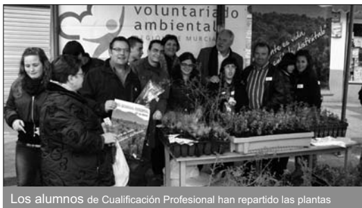
Los alumnos de Cualificación Profesional han repartido las plantas

El alcalde José Soria, el concejal de Montes, Joaquín Marín, y los alumnos de Cualificación Profesional Inicial del Instituto Alquipir han repartido alrededor de 800 plantas en la Plaza del Alpargatero, con motivo del Día Mundial Forestal. Los cehegineros han podido recoger pinos piñoneros, carrascas, espantalobos y lentiscos, de la dirección general de Patrimonio Natural.