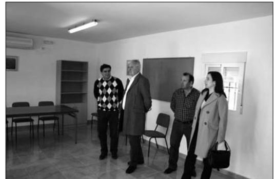
Se le ha instalado nuevo mobiliario e, incluso, aire acondicionado

Se han invertido en esta instalación unos 48 mil euros