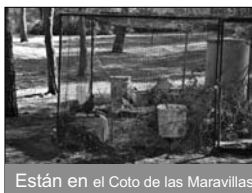
Están en el Coto de las Maravillas

jaulas de gran tamaño con bebedores y comederos, que dejaron