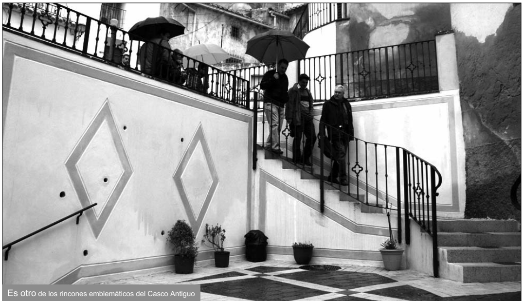
Es otro de los rincones emblemáticos del Casco Antiguo

Se ha arreglado un paño de la muralla y se ha iluminado