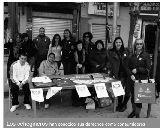
Los cehegineros han conocido sus derechos como consumidores