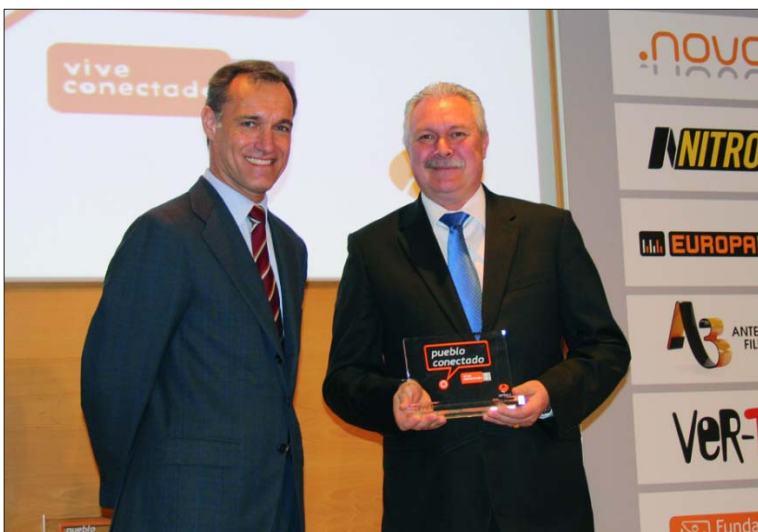
El alcalde de Cehegín recoge el galardón de manos del delegado del Grupo Antena 3 Televisión, en Madrid

Tal ha sido la repercusión de este premio, que los Informativos de la