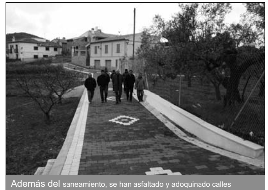
Además del saneamiento, se han asfaltado y adoquinado calles

El edil ha informado además de que "se han asfaltado todas las calles de El Escobar y los caminos rurales del Rojo, Fuente del Abad, Ermita, depósito, Muela,