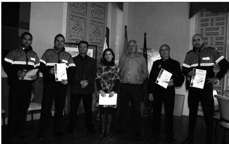
Los agentes han realizado el curso, impartido por el profesor de Defensa Policial de la Comunidad Autónoma

La defensa policial extensible, que se ha implantado en la mayoría de cuerpos policiales de la Región de Murcia, supone una mejora de dotación para los policías locales, dotándoles de una herramienta muy eficaz y ligera para las situaciones de riesgo.