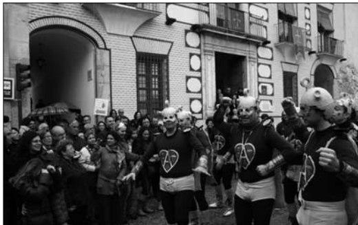
La chirigota Achomán puso música y diversión al Mercadillo Artesanal

Los miembros del Club del Pensionista celebraron a su vez su tradicional Baile de Carnaval en el Palacio de la Tercia, mientras que las calles de Cehegín se llenaban durante el desfile de Sábado de Piñata, en el que participaron 36 comparsas y grupos. Éste fue visto también a través de Internet por 1.078 usuarios de la red, proidentes de otras localidades, gracias a Cehegín Ciudad Digital y TV Cehegín.