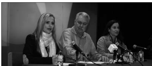
Las concejales y el alcalde encabezaron el acto de presentación

El acto ha contado también con la participación de diversas com-