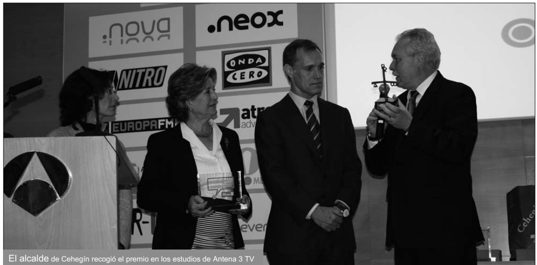
El alcalde de Cehegín recogió el premio en los estudios de Antena 3 TV

Cehegín viene trabajando desde hace años en el acercamiento de las nuevas tecnologías a los ciudadanos, intensificándose esta labor