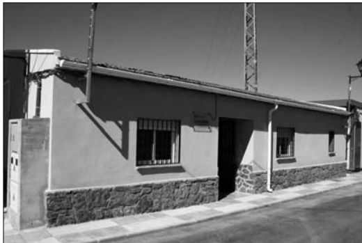
El Local Social es usado por los vecinos de la pedanía

El Local Social, que ha tenido una inversión de aproximadamente 48 mil euros, ha sido renovado por la empresa Ruygar, la cual ha colocado nuevo pavimento, un aseo, cuarto de limpieza, carpintería in-