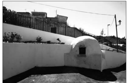
Así ha quedado el horno antiguo de la Casa Alta, propiedad de los vecinos

y secundarias, se han instalado barandas y un nuevo alumbrado público, así como el acondicionamiento de una zona con muros y