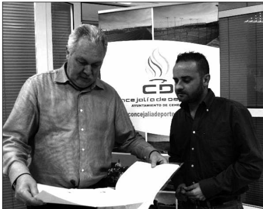
Los proyectos de estas obras están redactados y listos para ejecutarse

Marín ha explicado que “pretendemos comenzar con las obras dentro de dos semanas, siendo el coste de las mismas de 100.000 euros, financiados íntegramente