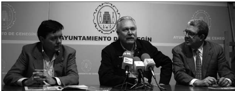
Las familias numerosas que soliciten el carnet de FANUMUR tendrán descuentos en los comercios de FECONORM

Este convenio, promovido por el Ayuntamiento, aplicará el Plan + Familia, por el que se beneficiarán las más de 250 familias numerosas