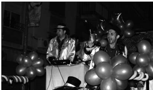
Hubo interpretaciones y playback de todo tipo