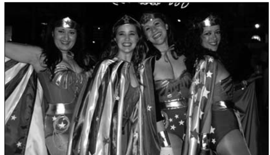
El Sábado de Piñata fue el día más especial de estos días de fiesta