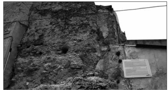
Los visitantes ya pueden conocer la historia de la Torre Martín Peres