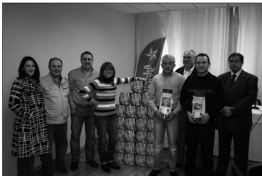
La tercera edición de la Ruta de la Tapa ha 'pulverizado' los datos del año pasado, con más de 200.000 consumiciones servidas, entre pinchos y cócteles

La tapa 'Vieira gratinada con salsa morney', de Restaurante D'Lucio, y el cóctel 'Apple Ibiza', de Pub Ibiza, han sido las elegidas para proclamarse vencedoras de esta edición, que ha 'pulverizado' los datos del año pasado, con más