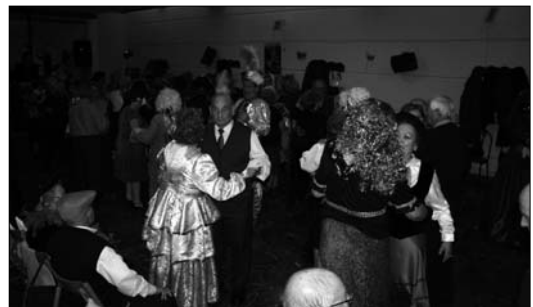
Los miembros del Club del Pensionista celebraron su Baile de Carnaval

BODEGAS CARREÑO FERNANDO CARREÑO PEÑALVER