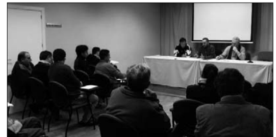
Está formado por partidos políticos, asociaciones, profesores, etcétera

El Espacio Joven de Cehegín ha albergado la constitución del Consejo Asesor del Deporte de Cehegín, adscrito a la concejalía de Deportes, y formado por partidos políticos, asociaciones de vecinos, representantes del profesorado de centros docentes públicos y privados, la FAMP, los clubes deportivos, un médico de la localidad, representantes del alumnado de centros docentes, asociaciones de discapacitados e igualdad, así como técnicos municipales en el