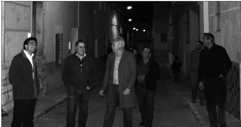
Las nuevas luminarias son más respetuosas con el medio ambiente, ya que ahorran mucha energía