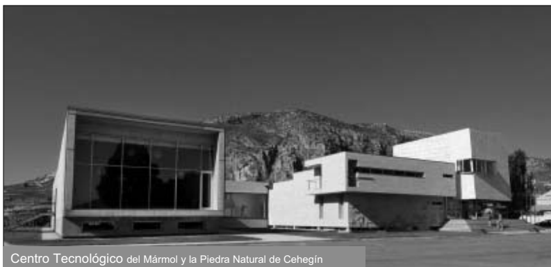
Centro Tecnológico del Mármol y la Piedra Natural de Cehegín