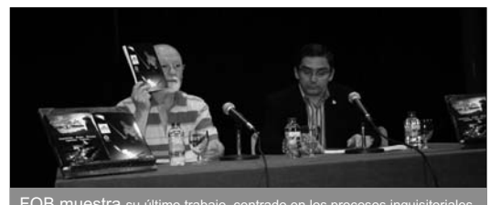
FOB muestra su último trabajo, centrado en los procesos inquisitoriales

Cerca de seis años de investigaciones y recopilación de datos ha