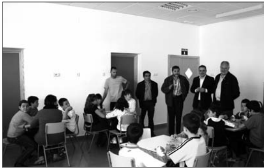
Los niños explicaron el funcionamiento de la cooperativa al alcalde

10 por ciento lo donarán a una ONG) les servirán para valorar esa experiencia, aunque ya tienen pensado solicitar un stand en el Mercadillo Artesanal 'El Mesonico' de Cehegín para dar salida a los productos en stock.