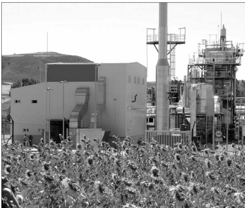
Planta de biomasa forestal de Corduente (Guadalajara), que además de producir energía, evita incendios y plagas

El objetivo de esta instalación será la producción de energía eléctrica, utilizando principalmente restos de podas y de arbolado de cultivos agrícolas, así como de