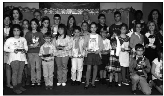
Cuatro niños de Cehegín han sido premiados por El Corte Inglés