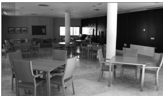
El comedor es muy práctico y cómodo, además de ser bastante amplio