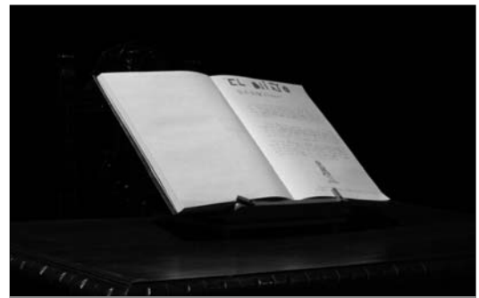
El Libro Gigante sigue siendo uno de los grandes atractivos