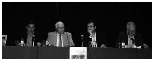
El escritor calasparreño (segundo por la derecha), presentando su libro