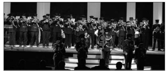
La Sala Camelot volvió a llenarse para ver las actuaciones de las bandas

tas y Tambores 'Ciudad de Cehegín', en la que la cálida temperatura y la multitud de público asistente han hecho que esta edición haya sido un éxito, desde los pasacalles matutinos hasta el concierto que cerraba la jornada.