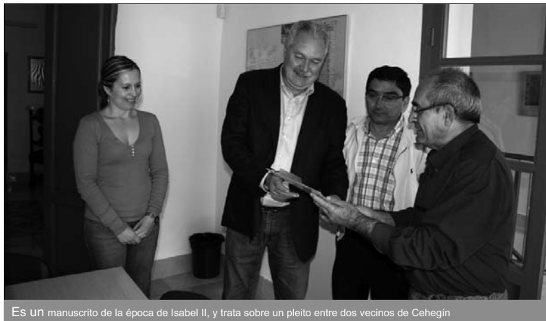
Es un manuscrito de la época de Isabel II, y trata sobre un pleito entre dos vecinos de Cehegín