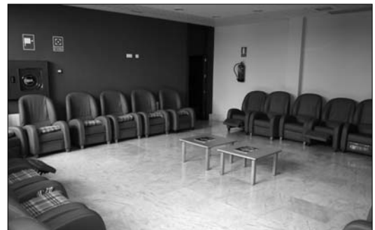
En estos sofás podrán echar la siesta o charlar los usuarios