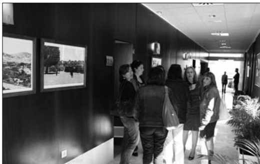
La entrada del nuevo centro desprende calidad en todos sus rincones

Los interesados en inscribirse en el Centro de Día como usuarios, deberán tener en cuenta que ya ha entrado en vigor el Decreto 306/2010 de la consejería de Política Social, por el que se aprueba la compatibilidad entre 'servicio' y 'prestación económica por cuidados en el entorno familiar' para usuarios de centros de día".