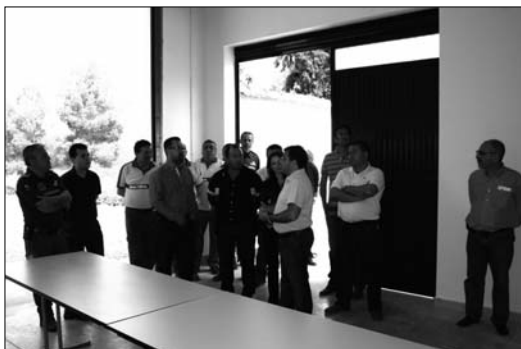
Los responsables de este centro visitaron las instalaciones