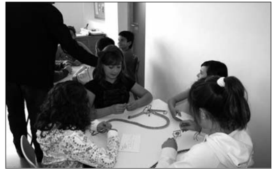
Confeccionan velas, cinturones, pulseras, bálsamos, ambientadores...

nicado que "la idea de la cooperativa nos ha parecido fantástica en el Ayuntamiento. De hecho, esto mismo es lo que estamos intentando inculcar a los adultos".