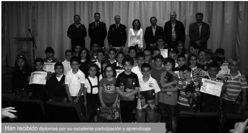
Han recibido diplomas por su excelente participación y aprendizaje

Un total de 402 alumnos han participado en estas jornadas, en las que han aprendido el significado de las señales más importantes y comunes, han circulado en bici-