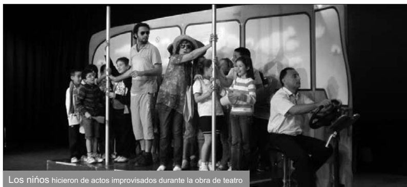
Los niños hicieron de actos improvisados durante la obra de teatro