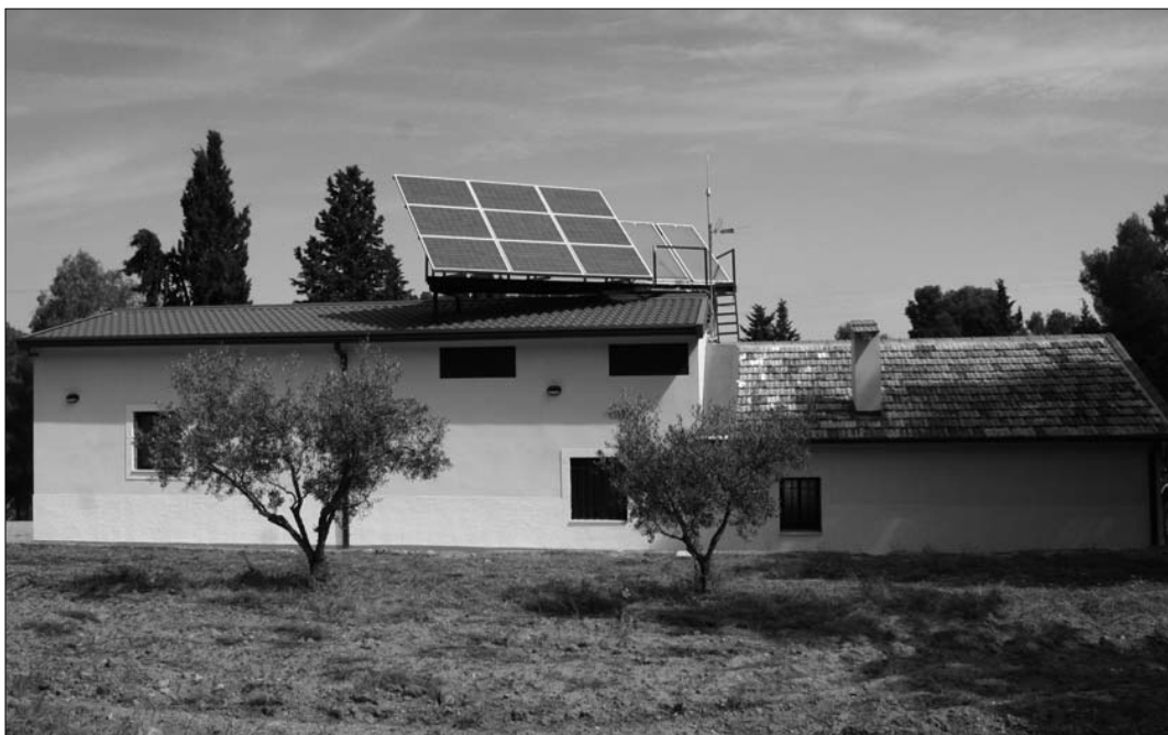
El nuevo Centro de Defensa Forestal se ha levantado sobre la antigua casa forestal, muy deteriorada por el paso de los años

Los exteriores del centro también han sido mejorados con la construcción de un área de aparcamiento y otras instalaciones auxiliares. Ha sido diseñado para ser autosuficiente en el consumo energético, a través de una pequeña estación fotovoltaica y eólica que garantiza, al menos, el 80 por ciento de la energía necesaria para su funcionamiento.