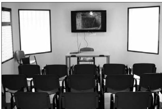
Además, cuenta con una sala de proyección de videos