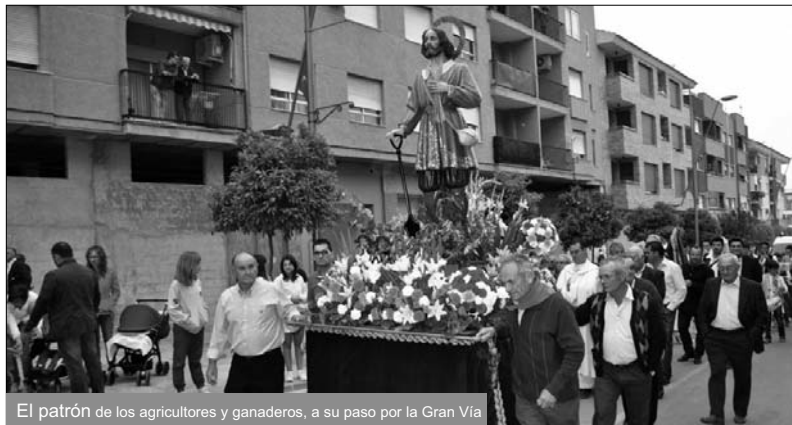
El patrón de los agricultores y ganaderos, a su paso por la Gran Vía