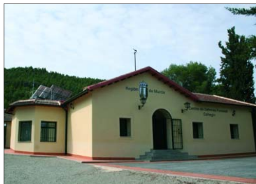
Cuenta con salas de emisoras, formación, dormitorios, aseos, cocina, etc