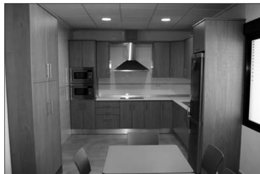
El centro tiene cocina y comedor para dar comodidad a sus usuarios