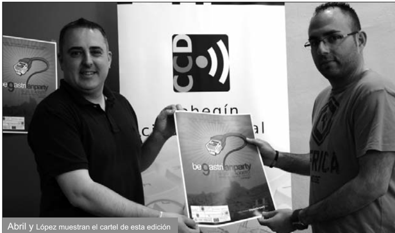
Abril y López muestran el cartel de esta edición

Los internautas interesados en participar en este evento podrán