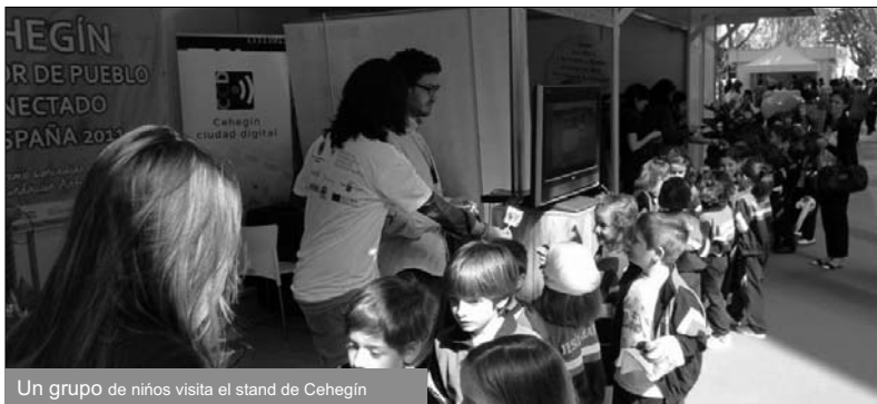
Un grupo de niños visita el stand de Cehegín

La Avenida Alfonso X El Sabio ha sido de nuevo el escenario elegido para el desarrollo de estas jor-