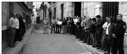
Los trabajadores del Ayuntamiento mostraron su apoyo a los lorquinos