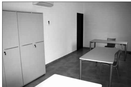
Tiene despachos y salas de formación para los agentes