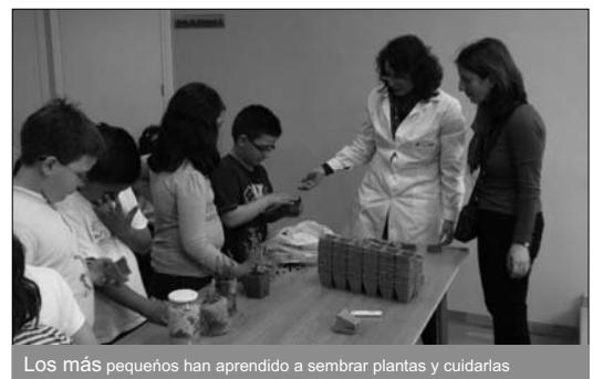
Los más pequeños han aprendido a sembrar plantas y cuidarlas